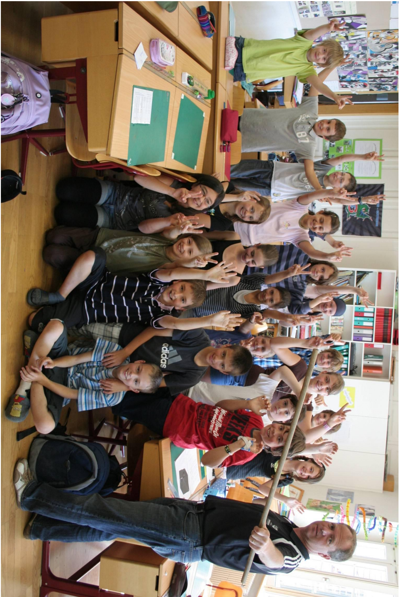
Après l'envers, l'endroit de la classe 5p de Vuisternens-en-Ogoz