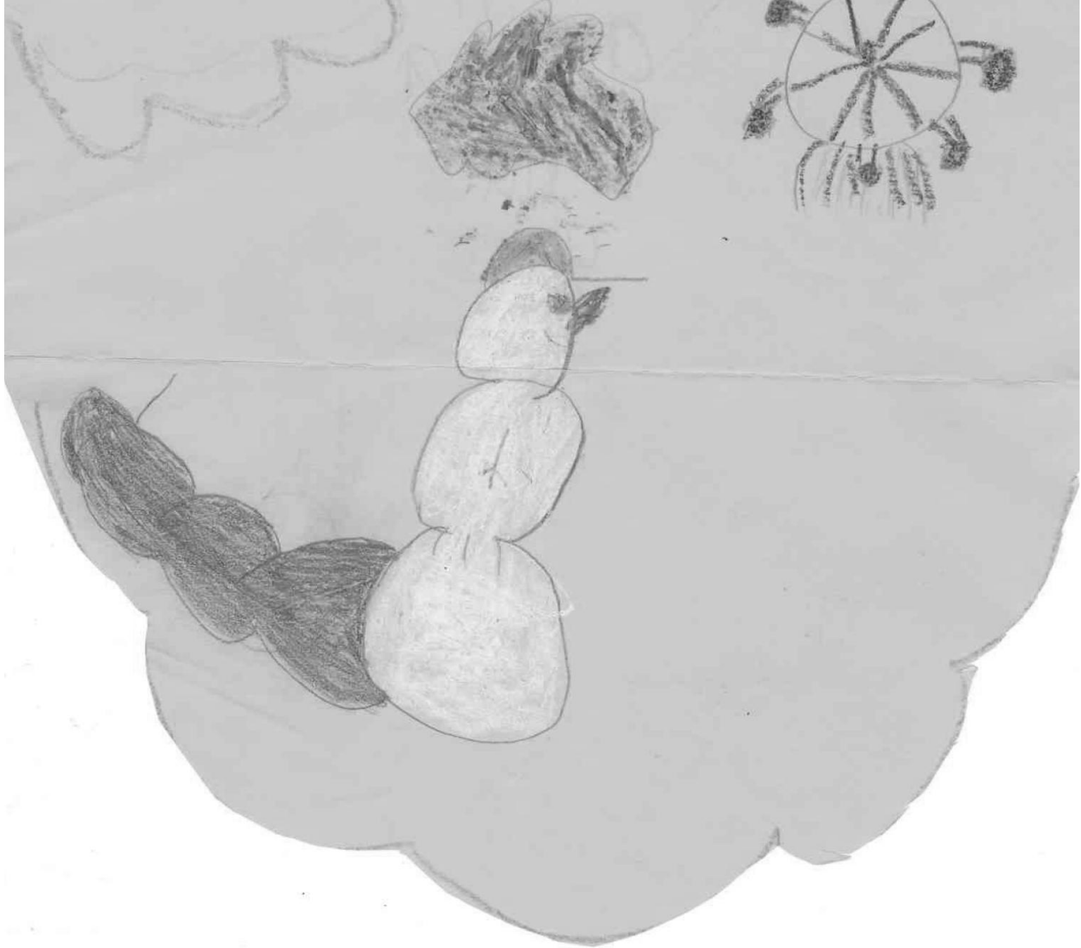
Giulia Elia - 9 ans

la neige va dans un cortège avec des manèges qui sont beiges